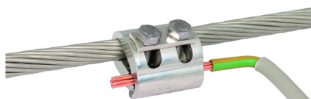
Zobrazení je nezávazné