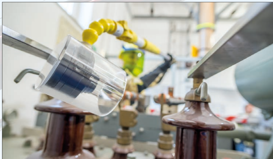
Kamerový systém umožňuje vizualizaci těžce přístupných míst